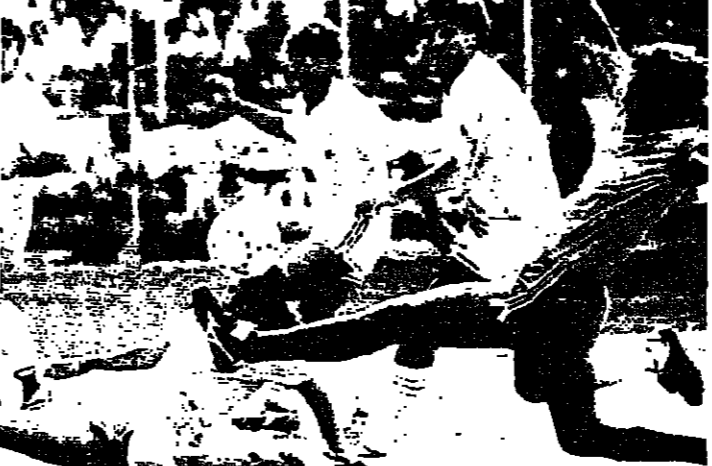
كينز البرازيل ويكره غوميز يضع فرصة على فريقه امام مرمى الارجنتين